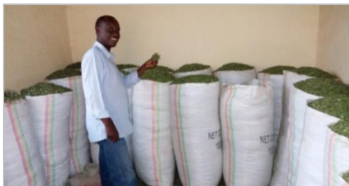
De opgeslagen oogsten

Het project kende heel wat moeilijkheden: patenten op het zaaigoed, die aangevochten moesten worden, problemen met bemesting, problemen met droogte, een landbouwingenieur die plots ontslag nam, ... Maar de Stevia van de voorbije oogsten (12 ton) bleef bewaard in daartoe bestemde opslagplaatsen. Dit jaar financierden we nog de aankoop van een machine (zo'n 1500€), die de bladeren omzet in poeder.