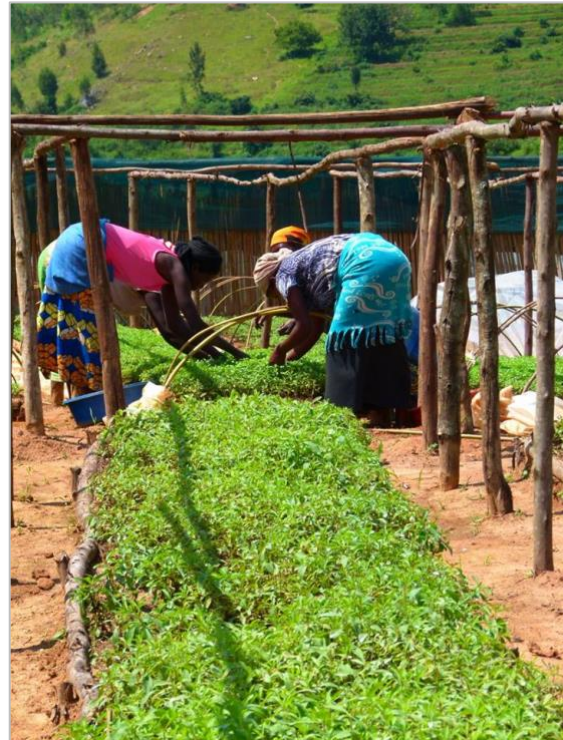
Verzorgen van het plantgoed

Het project kende heel wat moeilijkheden: patenten op het zaaigoed, die aangevochten moesten worden, problemen met bemesting, problemen met droogte, een landbouwingenieur die plots ontslag nam, ... Maar de Stevia van de voorbije oogsten (12 ton) bleef bewaard in daartoe bestemde opslagplaatsen. Dit jaar financierden we nog de aankoop van een machine (zo'n 1500€), die de bladeren omzet in poeder.