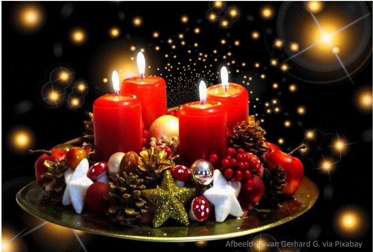
Afbeelding van Gerhard G. via Pixabay

Ik wens je een ster voor de donkerste nacht. Ik wens je zachtzinnig licht om het goede te zien in de wereld. Ik wens je woorden die niet breken maar verbinden. Ik wens je tussen het doodgewone nu en dan een godsgeschenk.