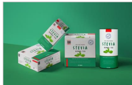
Eindproduct klaar voor de Rwandese markt

En - dit is een belangrijke stap en dus erg positief nieuws! - op 15 januari 2021 komt de door ons gefinancierde Stevia op de Rwandese markt!!